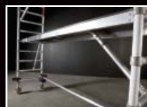
Plattform med hög frigång