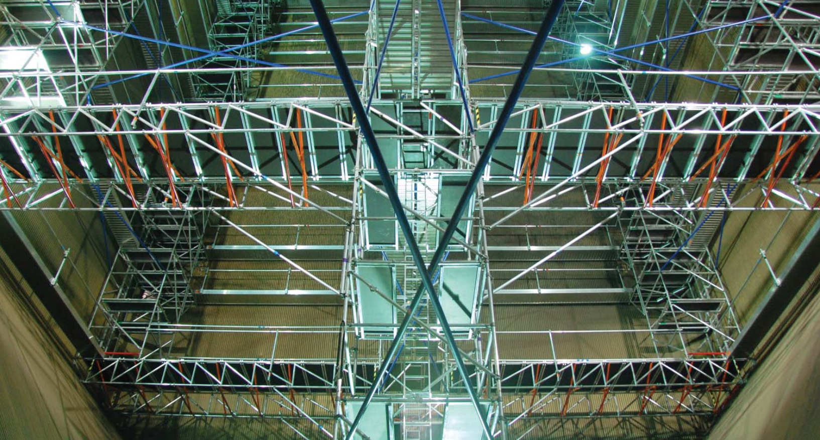
Ci-dessus : Système d'accès aux chaudières de Manjung, en Malaisie Unité de 660MW mise en service en novembre 2007. Vue du dessous de la trémie montrant la charpente à la base et la structure supérieure.