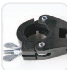
Agganciamento in nylon