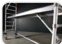
Piattaforma a cavalletto